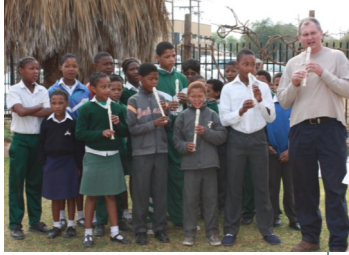
FARR se musikante