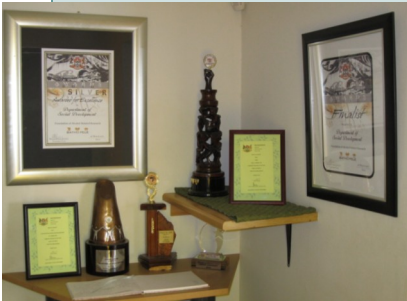
FARR se hoekie van glorie

FARR wil hiermee almal wat ons so getrou help in ons stryd teen FAS bedank. Sonder die hulp van terapeute en susters van die Departement van Gesondheid, plaaslike en Nasionale befonders en die bydrae van verskillende indi-